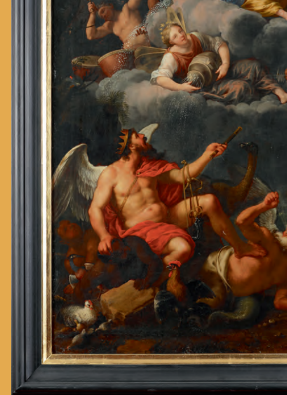
→ Johann Heiss (1640–1704), Vier-Elemente- Zyklus: Luft , 1690, Öl auf Leinwand, Detail

Stadtmuseum Memmingen Zangmeisterstraße 8 Eingang Hermansgasse 87700 Memmingen