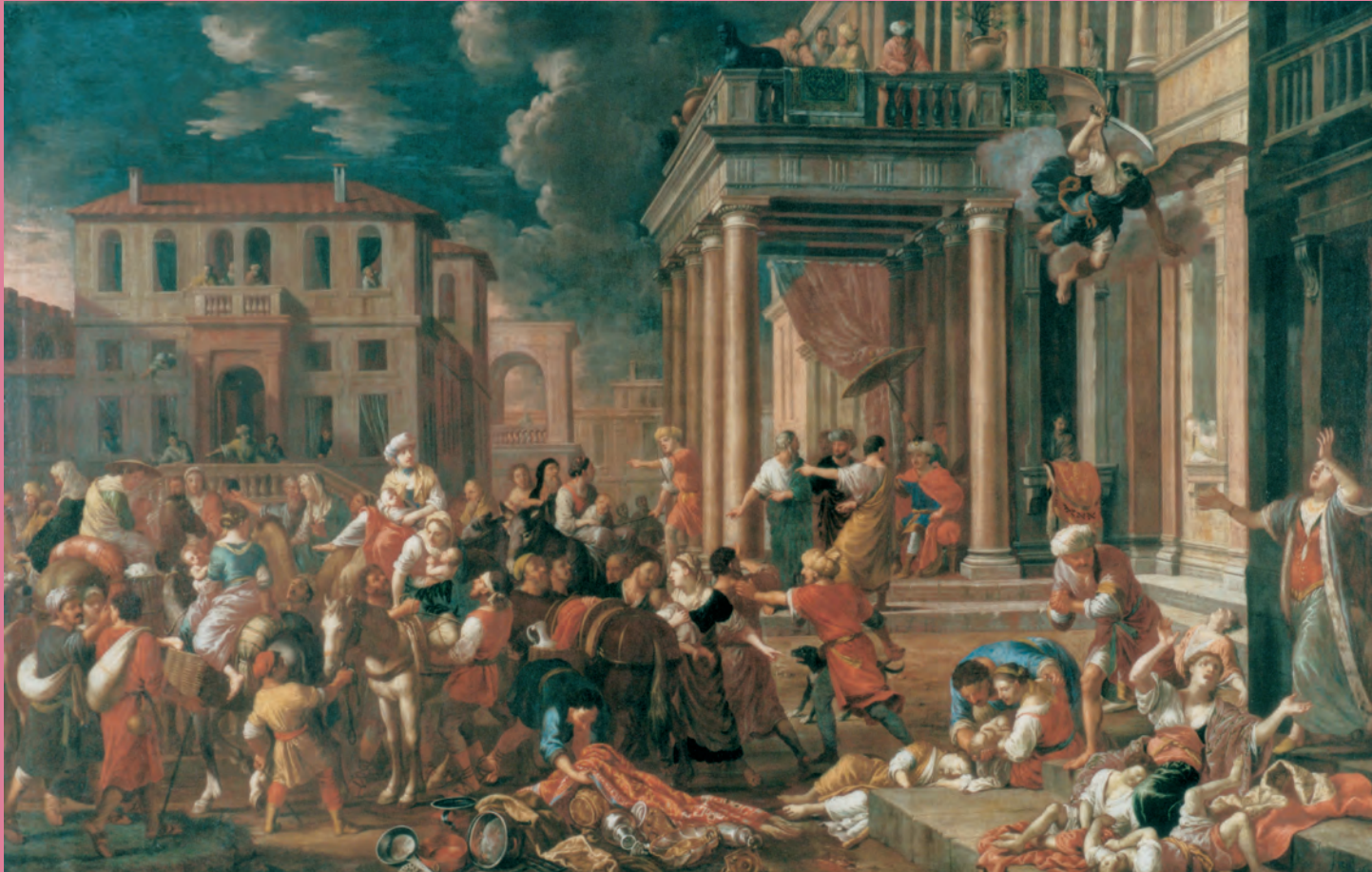
↑ Johann Heiss (1640–1704), Der Auszug der Israeliten , 1693, Öl auf Leinwand